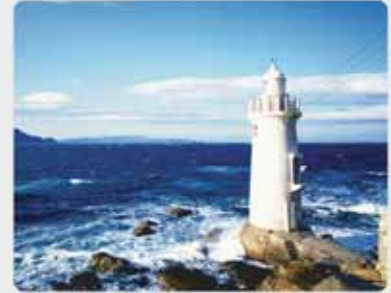
CEG Creditreform Consumer GmbH - Immer eine Information voraus -

Der Scorewert wird nicht zur Person gespeichert, sondern im Augenblick der Anfrage berechnet. Grundlage für die Berechnung sind Erfahrungen aus dem tatsächlichen Zahlungsverhalten von relevanten und repräsentativen Personengruppen und der Zugriff auf unsere Datenbank mit ca. 50 Millionen personenbezogenen Informationen.